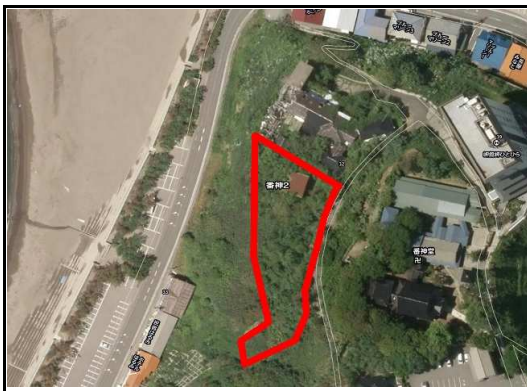
※図面が現況と異なる場合には現況優先となります。