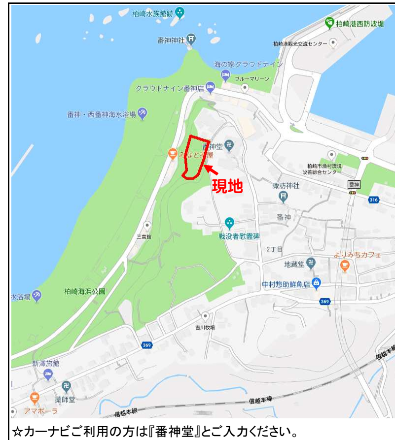
☆カーナビご利用の方は『番神堂』とご入力ください。