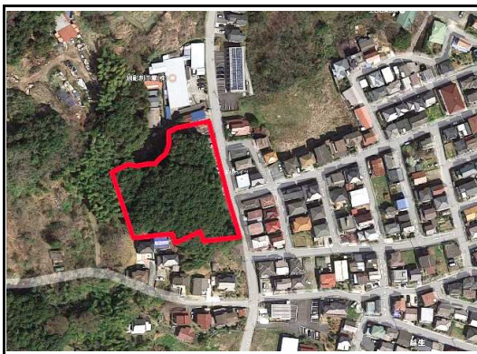
※図面が現況と異なる場合には現況優先となります。